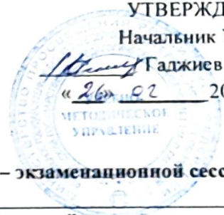
График ликвидации задолженностей студентов очного обучения факультета биологии, географии и химии по зимней зачетно – экзаменационной сессии 2025-2026 учебного года