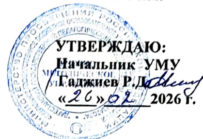
График пересдач академической задолженности за зимнюю зачетно-экзаменационную сессию 2025-2026 учебного года для студентов 1 года обучения магистратуры факультета начальных классов ОДО (магистерская программа: Дидактика начального образования)