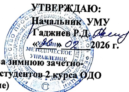
График пересдач академической задолженности за зимнюю зачетно-экзаменационную сессию 2025-2026 учебного года для студентов 2-курса ОДО (Профиль: Начальное образование) (Профили: Начальное образование и Иностранный язык)