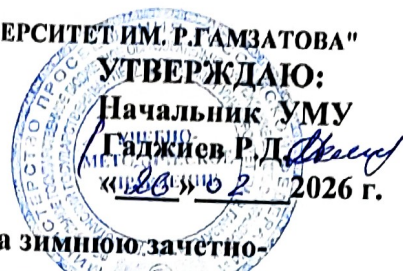
График пересдач академической задолженности за зимнюю зачетно- экзаменационную сессию 2025-2026 учебного года для студентов 4 курса ОДО (Профили: Начальное образование и Иностранный язык) (Профиль: Начальное образование)