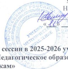
График второй ликвидации академической задолженности по итогам зимней зачетно-экзаменационной сессии в 2025-2026 учебном году студентов заочной формы обучения, обучающихся по направлению подготовки 44.04.01 - Педагогическое образование, Магистерская программа «Технологии обучения иностранным языкам»