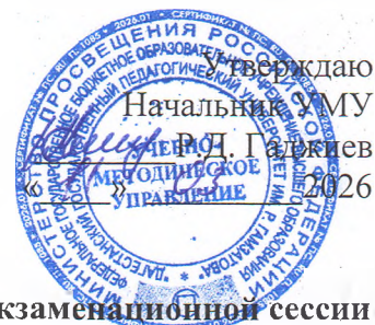
График 2-й (комиссионной) задолженностей зимней зачетно-экзаменационной сессии 2024-2025 учебного года для магистрантов 1 года заочной формы обучения факультета управления и права по направлениям подготовки