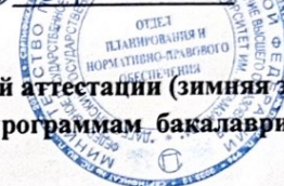
График второй ликвидации академической задолженности по итогам первой промежуточной аттестации (зимняя зачетно-экзаменационная сессия) в 2023-2024 году студентов очной формы обучения, обучающихся по программам бакалавриата